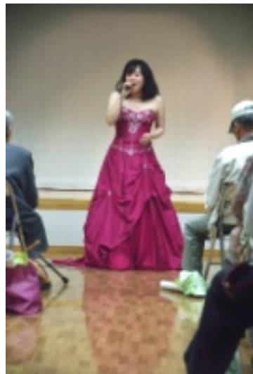
天使のような歌声で、 会場中がうっとり

2015年10月25日（日）ふれあいタウン大島にて第6回はつらつ交流会を開催いたしました。約50名ほどの会員様と一緒に楽しみました～院長も歌を歌ったり踊ったりと大活躍でした！